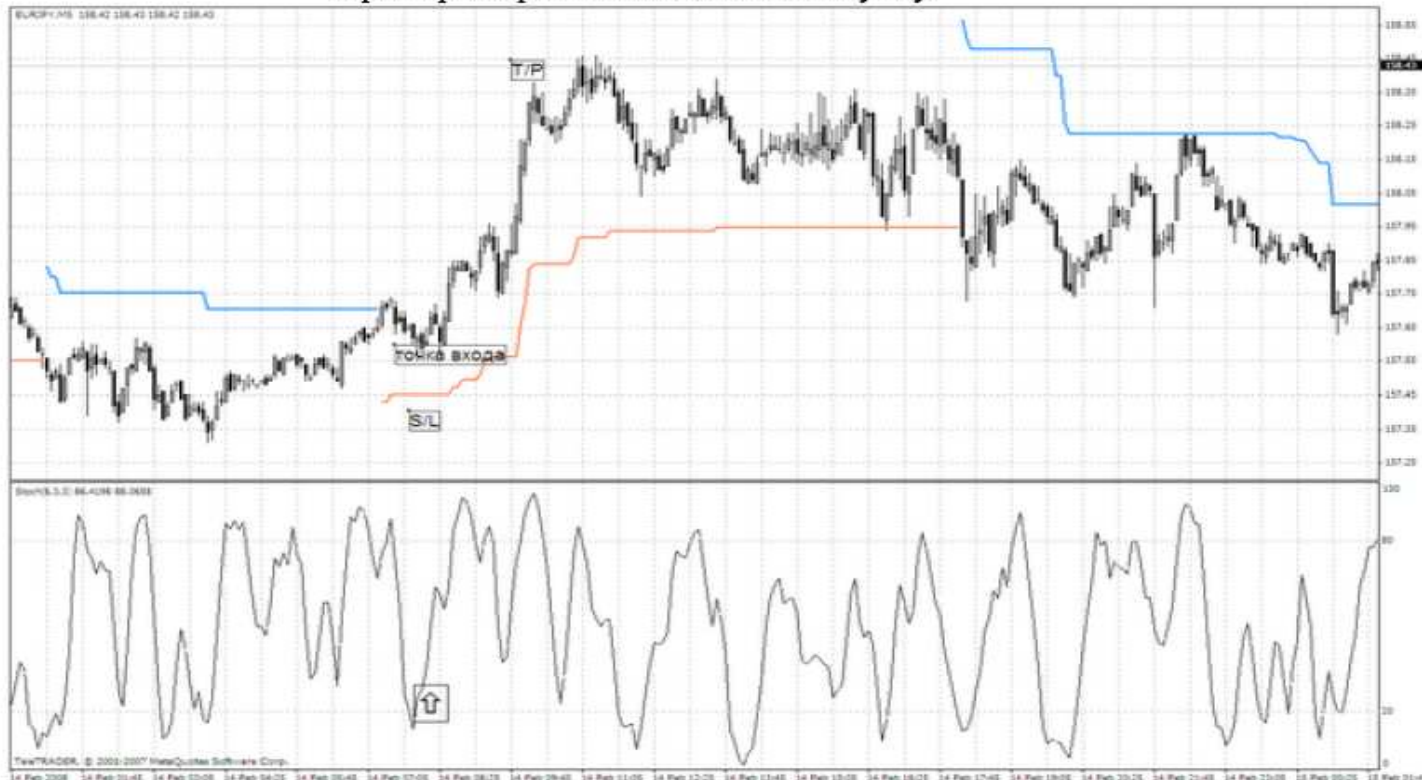
Пример открытия позиций на покупку